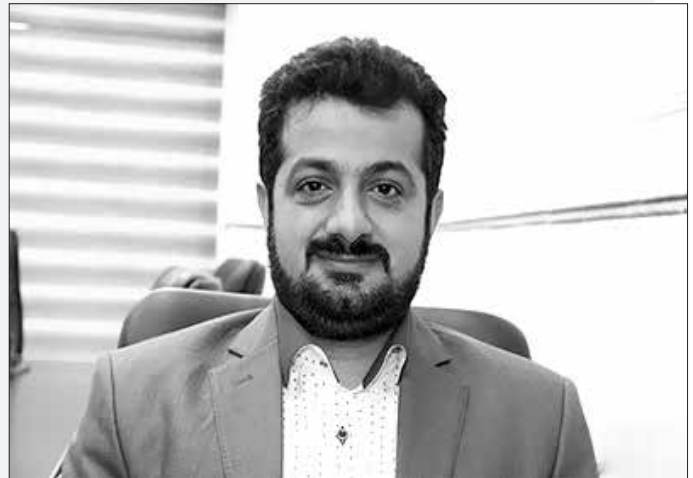
رئیس اتحادیه پیراهن دوزان و پیراهن فروشان، از ممنوعیت واردات پارچه طی ۱۰ روز گذشته خبر داد.

رئیس اتحادیه پیراهن دوزان و پیراهن فروشان، در پایان گفت: نزدیک به ۱۰ هزار واحد تولیدی در تهران و حومه تهران مشغول به فعالیت هستند.